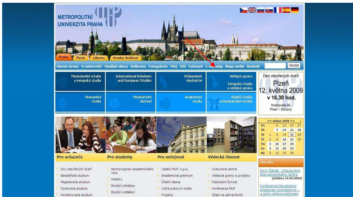
Obrázek 1: Odkaz na e-portál z univerzitní stránky

Do univerzitního e-learningového portálu se dostanete z naší oficiální stránky univerzity: www.mup.cz . Klikněte na odkaz „E-learning“ (obrázek 1).