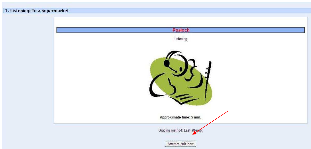
Obrázek 6: Vstup do gramatického cvičení