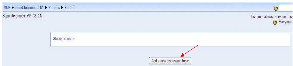
Obrázek 10: Možnost přidání nového diskusního tématu

Když se potřebujete vyjádřit nebo chcete informovat ostatní o svých pocitech a názorech nebo vyjádřit svou zpětnou vazbu, klikněte si na „ Přidat nové téma diskuse (Add a new discussion topic) “ (obrázek 10) a potom už jen vpisujete svůj text, případně můžete přidat i přílohu a taky se můžete rozhodnout, zda máte zájem všechny příspěvky daného fóra odebírat na Vaši e-mailovou adresu.