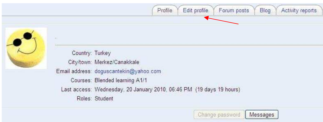
Obrázek 8: Změna osobního profilu