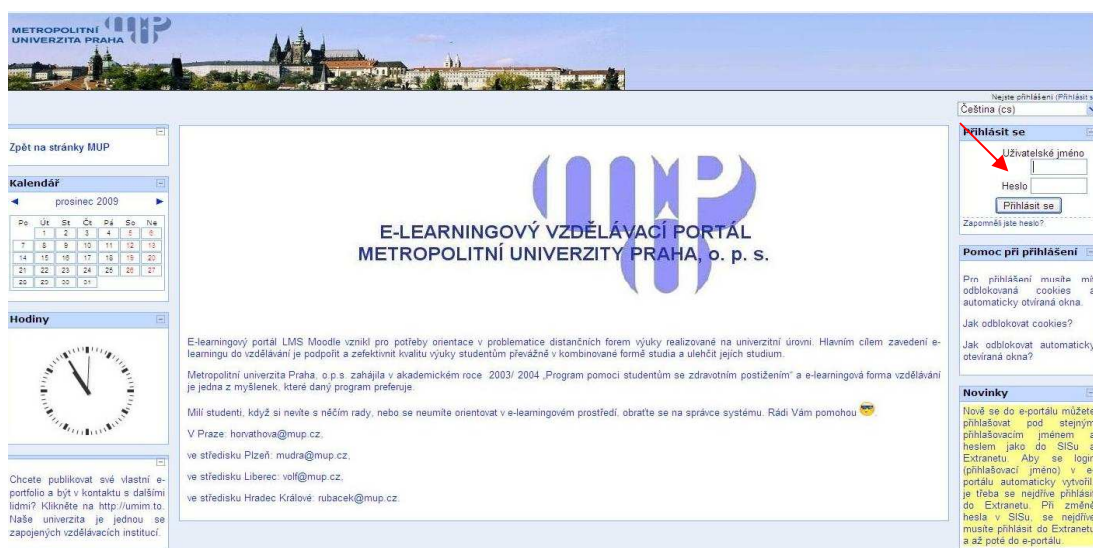
Obrázek 2: Možnost přihlášení do e-portálu

Aby bylo možné v daném prostředí pracovat, musíte mít vytvořené své uživatelské konto. Pro vytvoření uživatelského konta, prosím, kontaktujte správce e-portálu na e-mailové adrese: horvathova@mup.cz . Po vytvoření Vašeho účtu, sa přihlásíte do e-portálu pod vlastním uživatelským jménem a heslem.